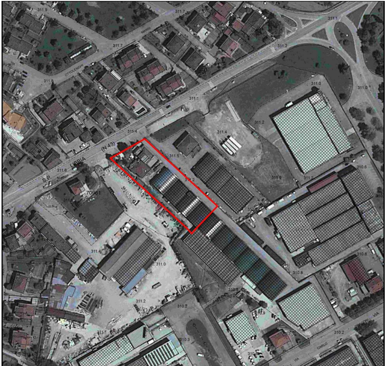
Estratto della foto aerea del 2010

produttive e commerciali da un lato e funzioni residenziali nelle frazioni e risulta quindi coerente e compatibile con il vigente P.S..